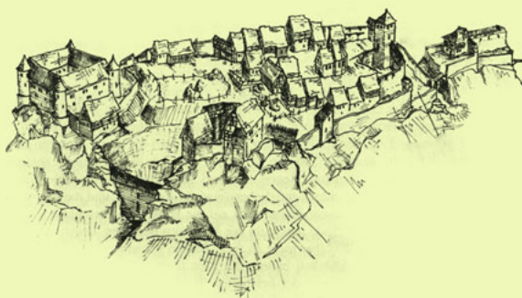
Fiktive Darstellung der Schalksburg.

Der historische Hintergrund der Sage vom Hirschgulden ist der Wechsel der Herrschaft Schalksburg samt Balingen von Hohenzollern an Württemberg im Jahr 1403: Graf Friedrich V. von Zollern-Schalksburg, genannt Mülli, verkaufte seinen Besitz nach dem Tod des einzigen Sohnes. So wurde Balingen, umgeben von den Herrschaften Hohenzollern und Vorderösterreich, württembergisch – und im weiteren Verlauf der Geschichte ein protestantischer Fleck in katholischer Umgebung.