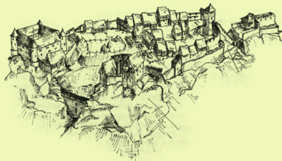
Fiktive Darstellung der Schalksburg.

Der historische Hintergrund der Sage vom Hirschgulden ist der Wechsel der Herrschaft Schalksburg samt Balingen von Hohenzollern an Württemberg im Jahr 1403: Graf Friedrich V. von Zollern-Schalksburg, genannt Mülli, verkaufte seinen Besitz nach dem Tod des einzigen Sohnes. So wurde Balingen, umgeben von den Herrschaften Hohenzollern und Vorderösterreich, württembergisch – und im weiteren Verlauf der Geschichte ein protestantischer Fleck in katholischer Umgebung.